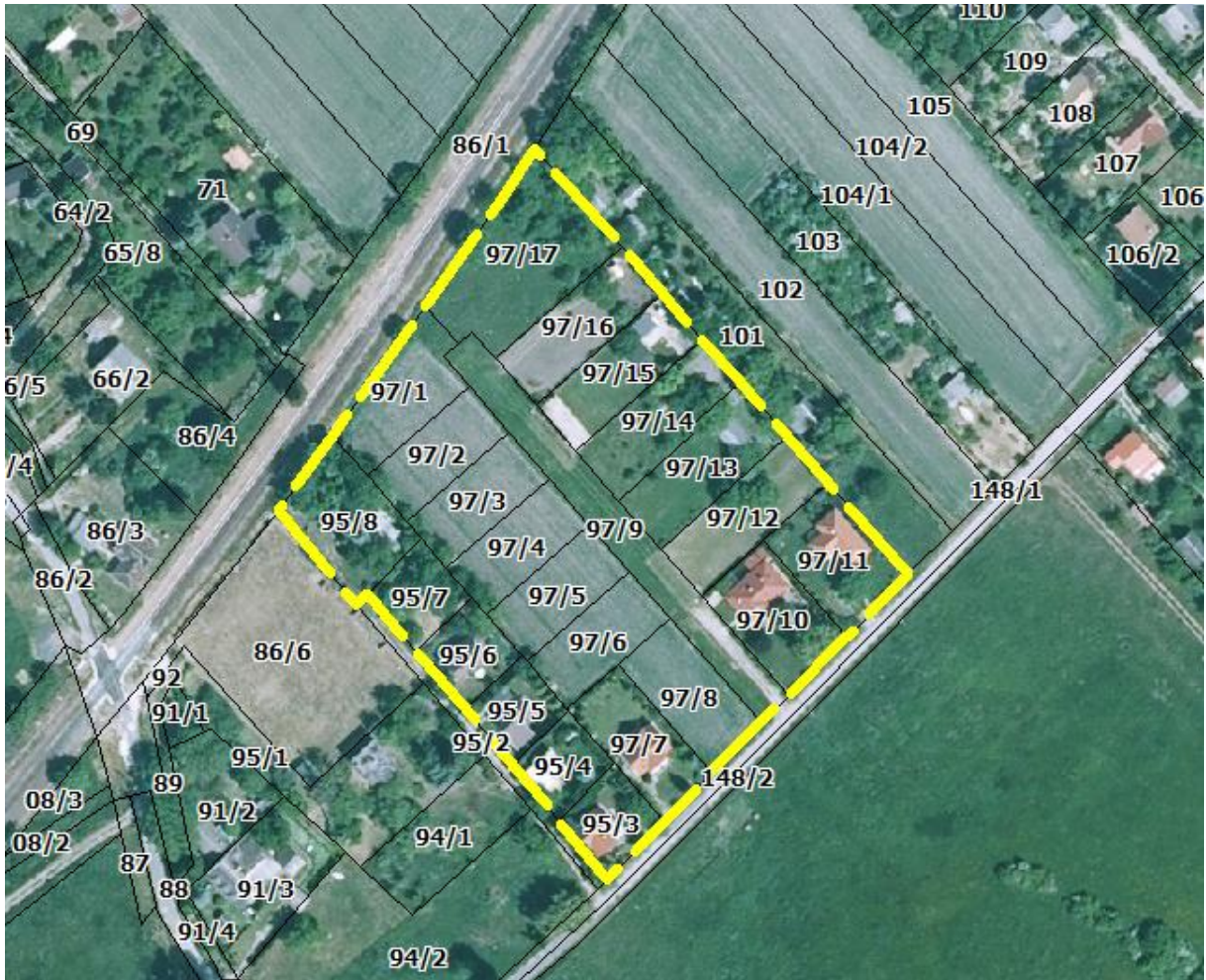
A tervezési terület lehatárolása

97/1 és 97/17. hrsz. ingatlanokat érintő módosítás esetében