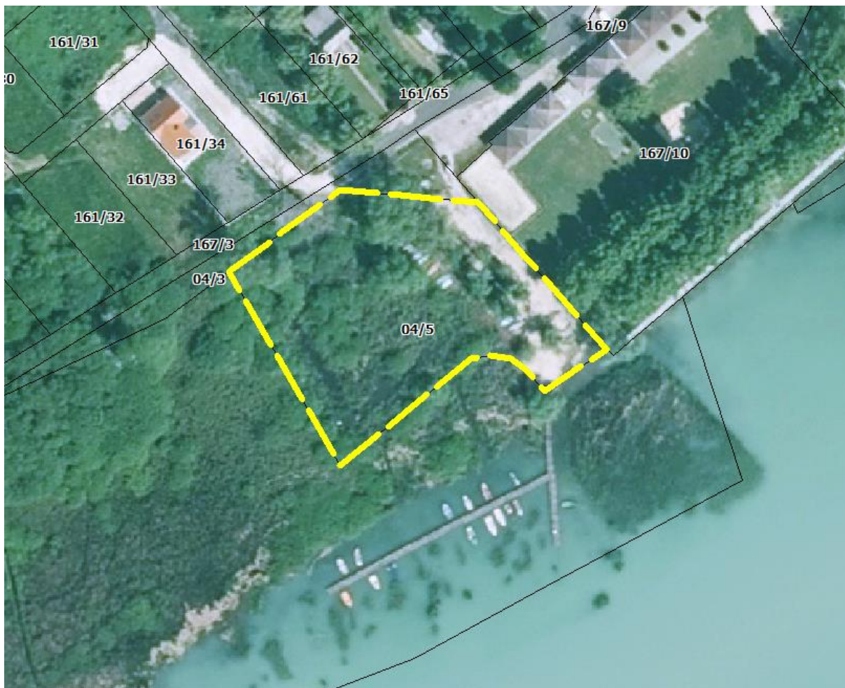
A tervezési terület lehatárolása

04/5 hrsz. ingatlant érintő módosítás esetében