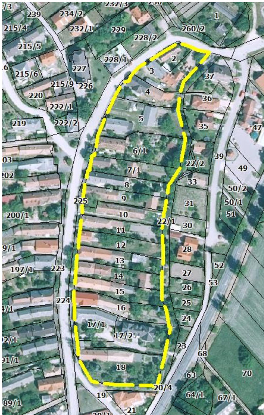
A tervezési terület lehatárolása

18. hrsz. ingatlant érintő módosítás esetében