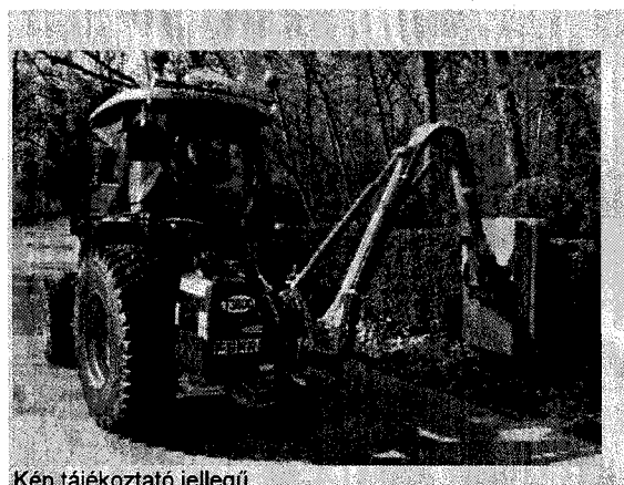
Kép tájékoztató jellegű